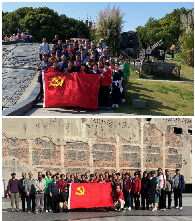
在红色教育基地合影

上海四行仓库抗战纪念馆为上海唯一的战争遗址类爱国主义教育基地，位于上海静安区（原闸北区）南部的仓库建筑。原是大陆银行和北四行联合仓库，淞沪会战时期，这里曾驻扎 452 名国民革命军将士英勇抵抗日军的进攻。1985 年 9 月 3 日，上海市文物保管委员会正式将其命名为“八百壮士四行仓库抗日纪念地”。以中外著名的“四行仓库保卫战”为基本陈列，按照“尊重历史，真实反映”的理念，展示在抗日民族统一战线旗帜下和全面抗战的背景下，1937 年