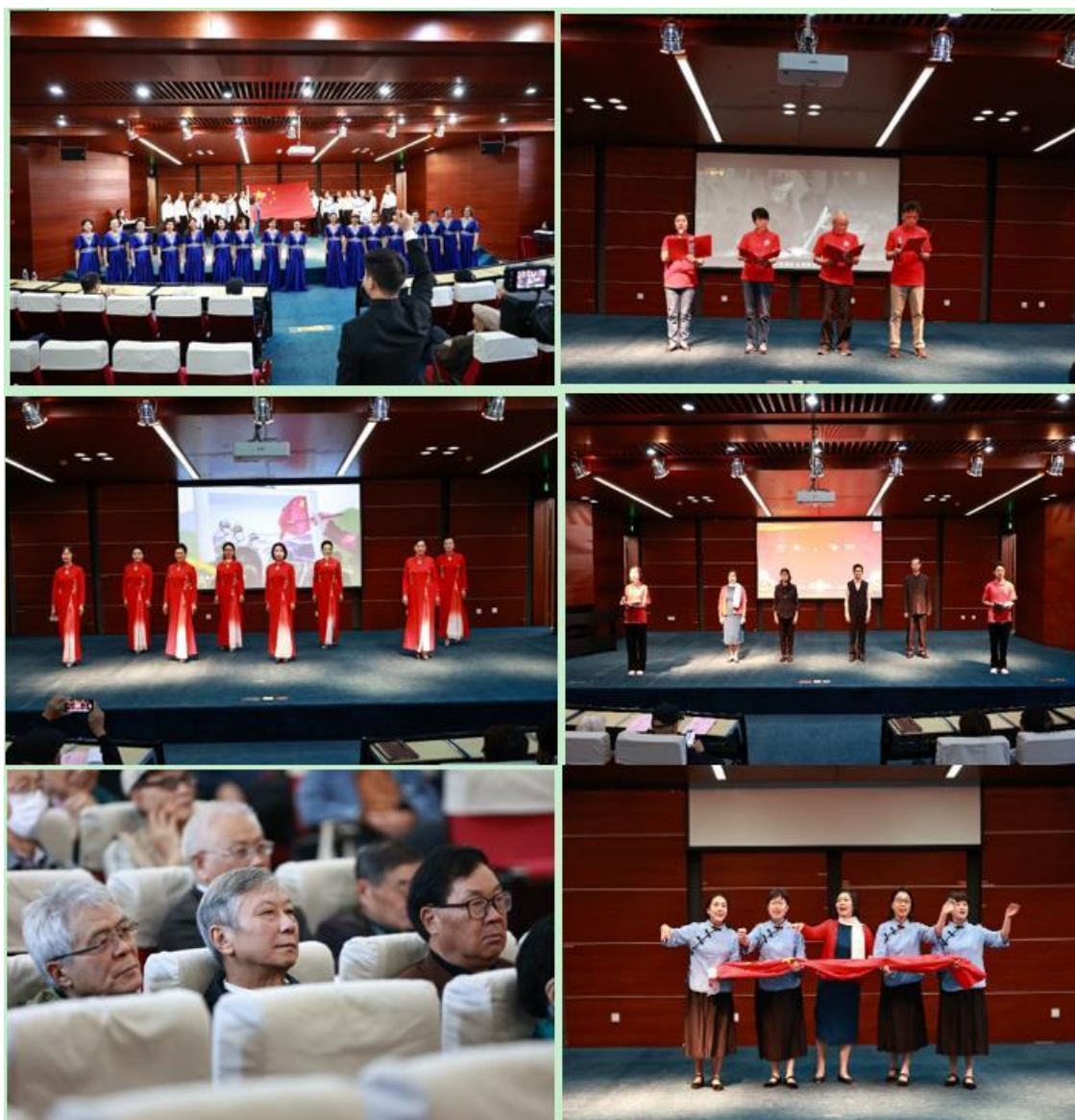
校情通报会暨艺术党课现场

满完成主题教育各项工作，取得了实实在在成效。离退休干部党员认真参加主题教育，以工作提质增效检验主题教育成果。当前高水平大学建设需要凝聚各方面力量，希望广大老同志充分发挥独特优势，始终关心、支持和帮助学校事业发展，继续为立德树人发光发热、贡献力量。