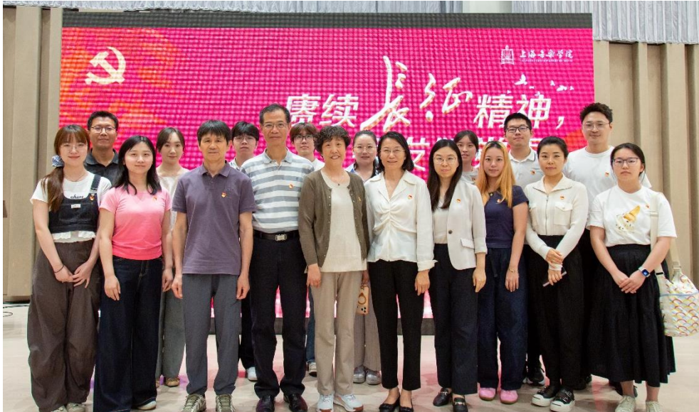
关工委老同志与师生代表同上一堂艺术党课

活动以“百年育人大讲堂”开篇，李明明老师作《祖国的需要高于一切——记常留柱教授援藏 20 年先进事迹》专题分享，讲述了上音前辈常留柱扎根雪域高原、深耕边疆音乐教育二十载的动人故事，生动展现老一辈文艺教育工作者响应国家号召、甘于为国奉献的初心使命。在文艺党课篇章，多元器乐演绎红色经典，红色戏曲与合唱徐徐铺展了长征史诗画卷，穿插的特色微宣讲与情景朗诵引发情感共鸣，让现场观摩的师生直观地感受红色音乐作品独特的精神力量。活动尾声，徐汇区退休干部合唱团献上大合唱《革命人永远是年轻》《在希望的田野上》，银发老党员的嘹亮歌声传递代代相传的红色信仰，充分展现老中青文艺工作者永葆热忱、紧跟时代的精神风貌，也为本次观摩学习画上圆满句号。