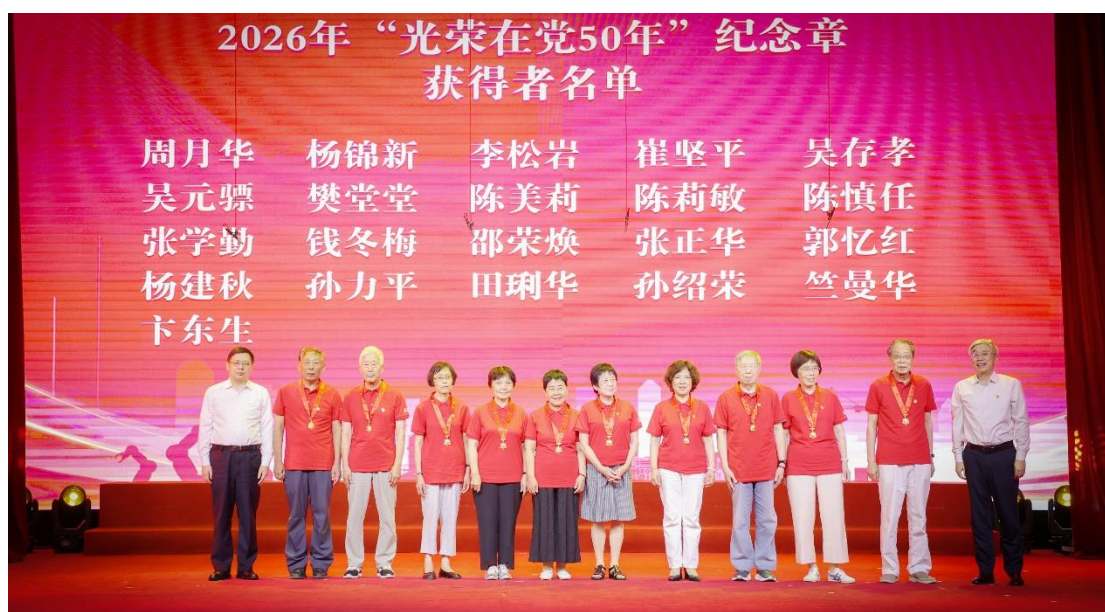
校领导为老党员代表颁发“光荣在党50周年纪念章”

6月26日，学校举行“两优一先”表彰大会暨“解码大国制造的时代答卷”示范党课。校领导班子成员、全体中层干部、“光荣在党50年”老党员代表、“两优一先”党员代表、党员师生代表等600余人齐聚一堂，沉浸式体会大国制造的奋进力量，感悟上理人的使命担当。我校老同志以情景表演、领授“光荣在党50年”纪念章、重温入党誓词等多种形式参加。