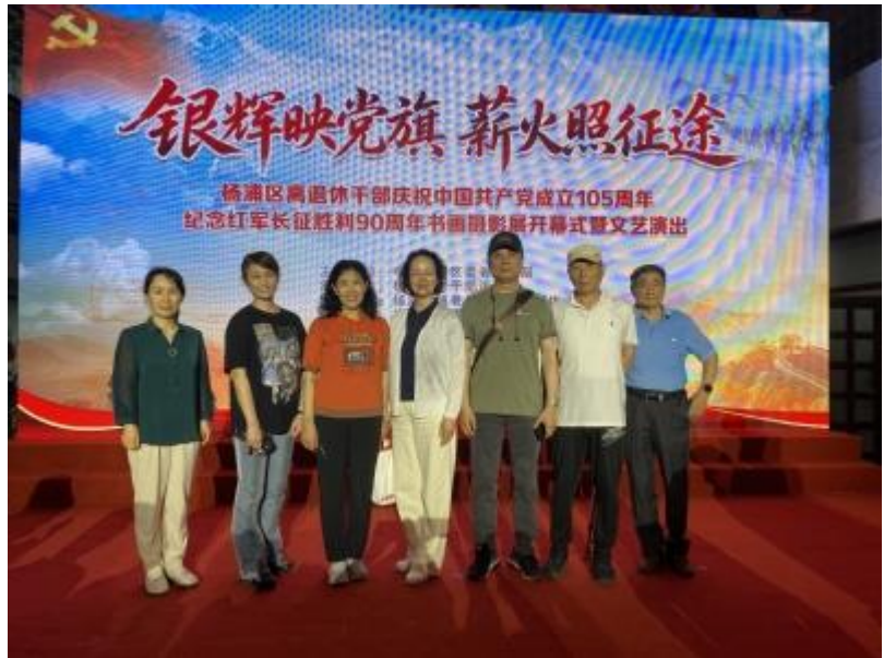
参展作者代表合影

心的精神财富。我校老同志提交的 8 幅作品以翰墨抒壮志、以光影记初心，表达了对党的无限忠诚、对长征精神的深刻感悟、对新时代美好生活的热爱。我校离退休党委将坚守为老服务初心，用心用情做好老干部服务保障工作，持续搭建更多优质平台，全力支持广大离退休干部老有所学、老有所乐、老有所为，为奋力