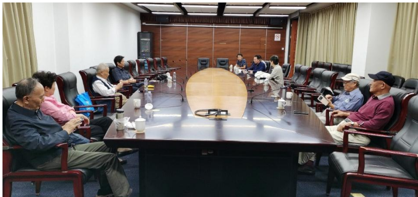
局级退休支部主题党日活动现场

强劲势头，听后精神振奋，深受鼓舞。大家均感到，在党委班子的坚强正确领导下，学校奋斗目标清晰，发展举措有力，全校师生同心同德，奋发图强，锐意进取，学校高水平大学建设步入快速发展的“快车道”。