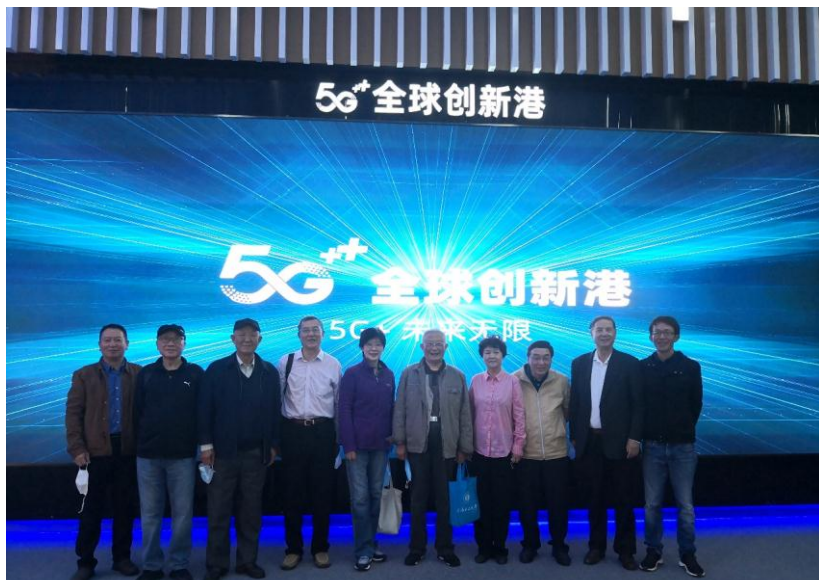
支部同志在5G全球创新港合影

老同志们首先来到去年9月正式开港的全球首个综合性5G应用展示及联创平台——“5G全球创新港”。该港区集5G技术展示、联创平台、场景应用、科学普及等诸多功能于一体，云集了一批5G高端行业和产业企业，旨在以上海落地5G“双千兆宽带城市”为契机，加速行业 and 数字经济的智慧转型，并激发上海科技经济活力。