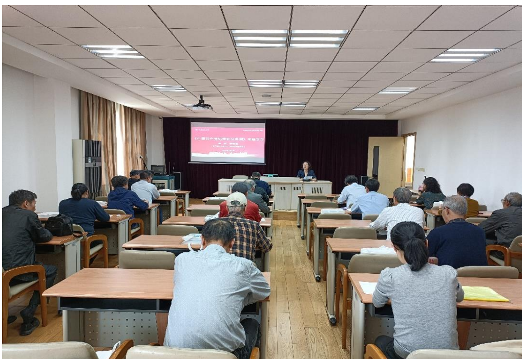
党纪学习教育专题党课

5月7-8日，离退休党委组织的离退休党务干部学习贯彻习近平考察上海重要讲话精神和《关于加强新时代离退休干部党的建设工作的实施意见》专题培训班在上海科技管理干部学院举办。离退休党委委员、离退休干部党支部书记、特邀党建组织员、“尚