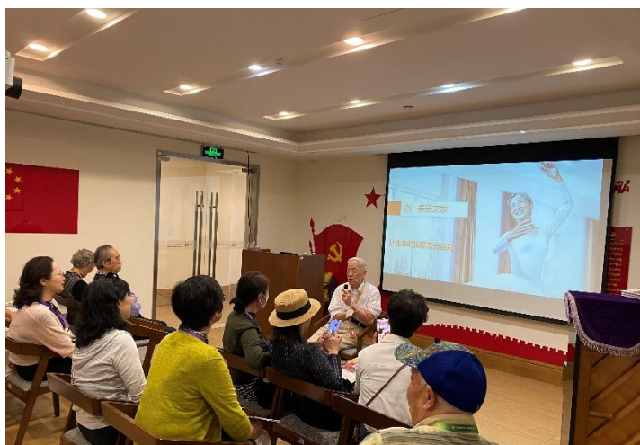
参观老同志和入住老教授座谈

在泰康工作人员的陪同和讲解下,合唱团的老同志们参观了社区食宿、活动、医疗等软硬件设施,以及泰康未来的发展愿景。大家一边参观一边感慨,党的