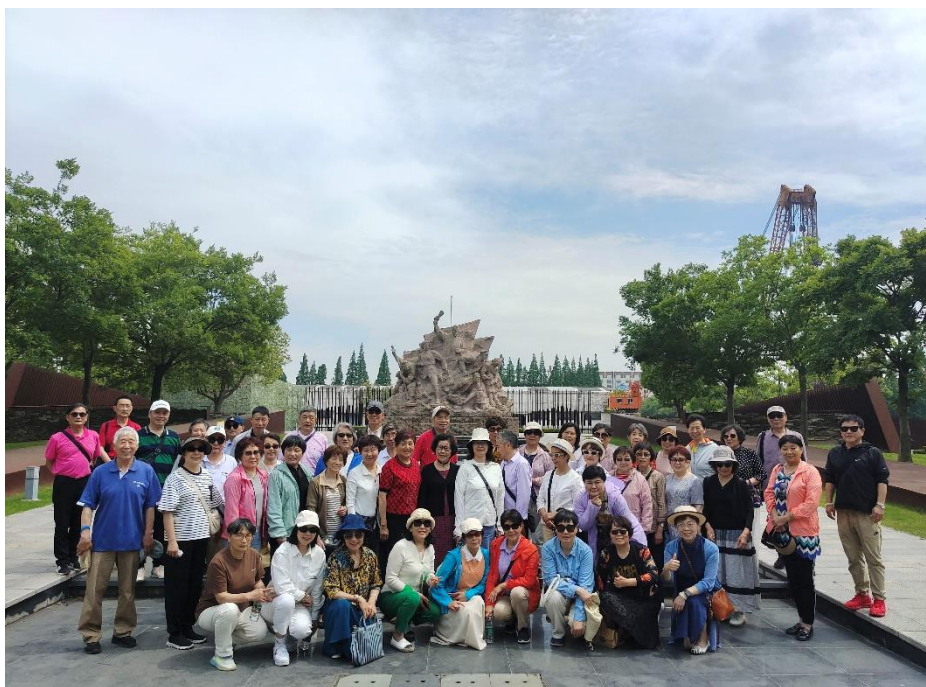
参观金山卫抗日遗址纪念园

活动中，东林寺的恢宏气势、金山卫抗日遗址纪念园的悲愤历史、金山嘴渔村的发展轨迹、花开海上生态园和枫泾古镇的自然与人文之美，给大家留下了深刻印象。老同志们边参观边感慨，要铭记历史、勿忘国耻、牢记使命，祈福祖国强大昌盛、人民幸福安康。